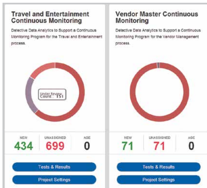
Figura 3: Ofrece rápidamente visibilidad ejecutiva en las áreas clave del negocio

Aumente la garantía empresarial y obtenga una valiosa visibilidad de las áreas clave del negocio mediante la expansión de sus programas de análisis a otras funciones de la empresa.